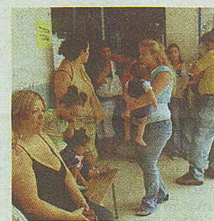
El IMAS de Cristo Rev recibió pade-

Esta medida pretende un mejor uso de los dineros de las 129.800 becas dadas, a la fecha, a colegiales de familias pobres. ■